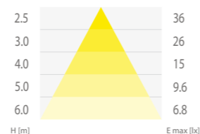
Milo LED ECO 10