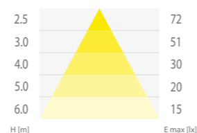
Milo LED 20 W